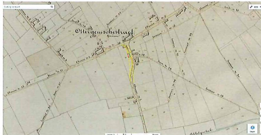
Uittreksel uit de atlas der buurtwegen (Schaal: 1/2500)